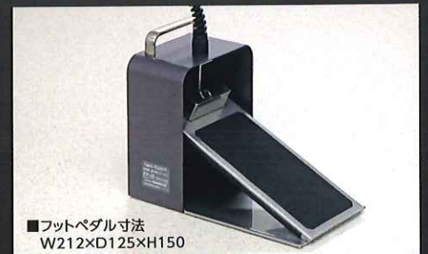
■フットペダル寸法 W212×D125×H150