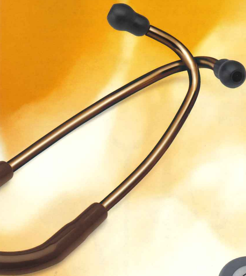
5809 Copper Edition (銅色加工)