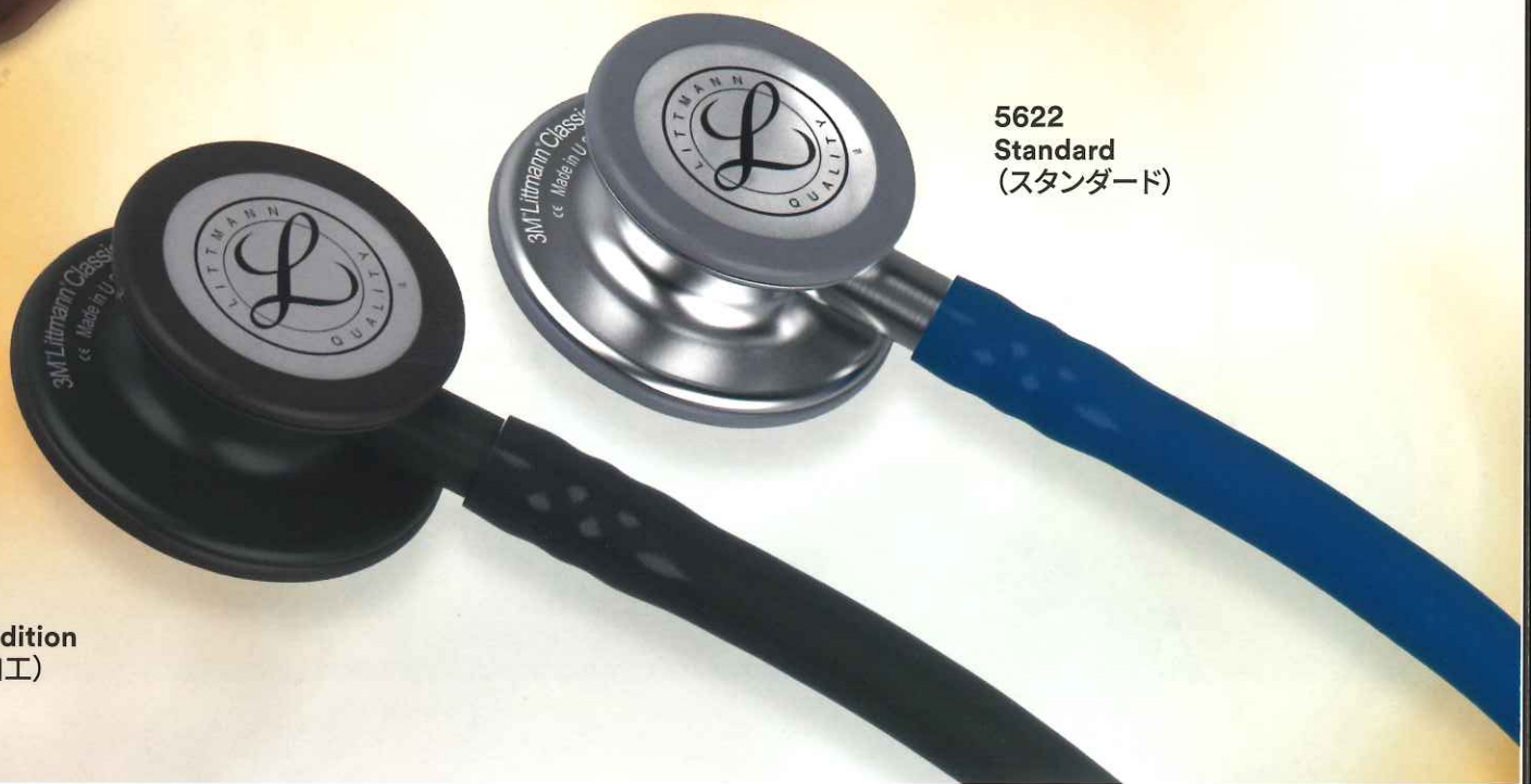
5622 Standard (スタンダード)