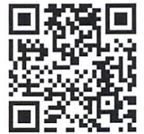
山根式フランジ法動画

この手法に於ける針の刺入位置と角度は非常に重要で、IOL固定術への影響が大きい ため本製品で常に一定角度での針の刺入をサポートすることで、術後のIOL偏心傾斜の 予防にお役立ていただけます。