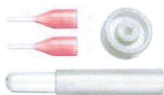
CENTURION®イントレピッド® ウルトラスリーブ