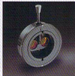
コントラストエンハンスing (イエロー) フィルタ (オプション)

倍率は 10 倍・16 倍・25 倍の 3 段階で、接眼レンズは口径が大きく広い観察野が得られます。コントラストエンハンスing (イエロー) フィルタ (オプション) は、フルオレセイン検査の際のコントラストを更に高めます。スリットランプに常に取付けておくことができ、レバー操作一つで切換できます。